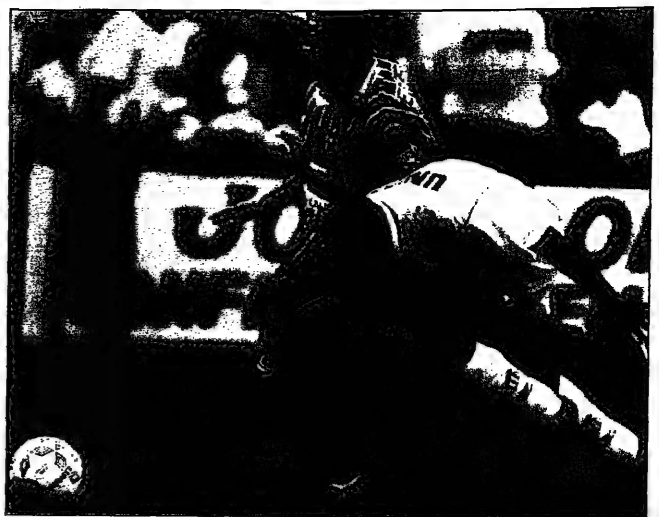
لاعب فريق بوكا جونيورز (وسط) يحاول انقاذ الكرة (يمين)